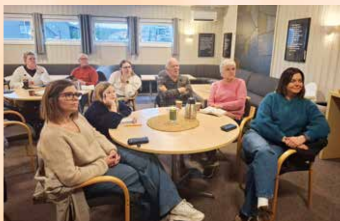
Her får gjestene lære nye ting om Ruths bok.