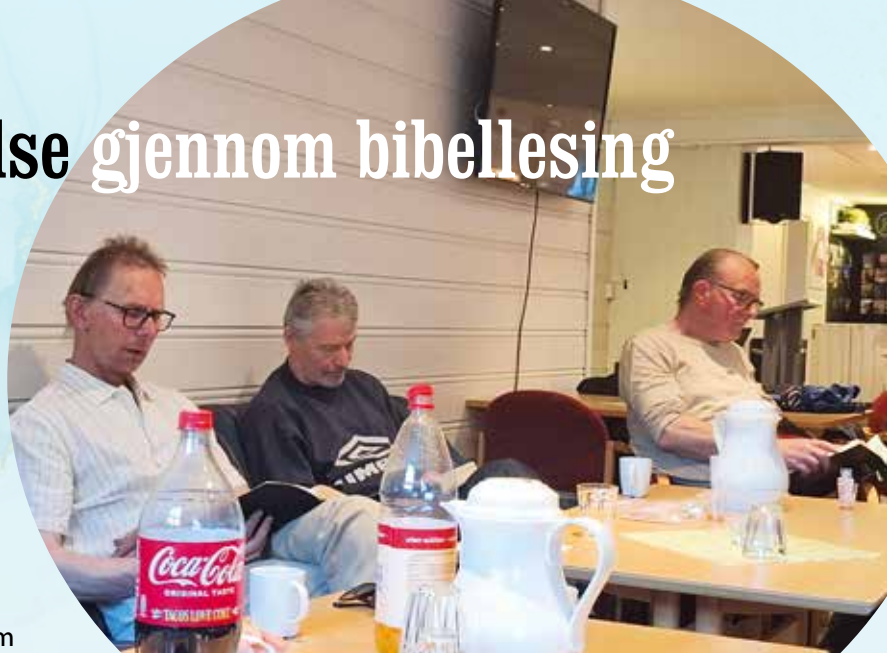
På mannsgruppa er det rom for spørsmål til tekstene som leses.

– Vi har gått igjennom bøker i Bibelen som er oppbyggende for kristenlivet.